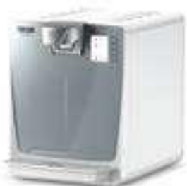
WPD 200 Advanced White

Filter, Standfüße, Becherspender, Kanister, Druckminderer und andere Anbausätze sind separat zu bestellen.