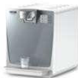
WPD 200 Basic S White