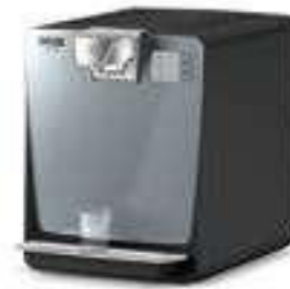
WPD 200 Basic S Black