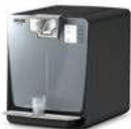
WPD 200 Advanced Black

Filter, Standfüße, Becherspender, Kanister, Druckminderer und andere Anbausätze sind separat zu bestellen.