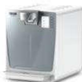
WPD 200 Advanced S White