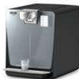
WPD 200 Advanced S Black