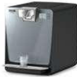
WPD 200 Basic Black

Filter, Standfüße, Becher- spender, Kanister, Druckminderer und andere Anbausätze sind separat zu bestellen.