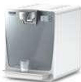
WPD 200 Basic White

Filter, Standfüße, Becher- spender, Kanister, Druckminderer und andere Anbausätze sind separat zu bestellen.