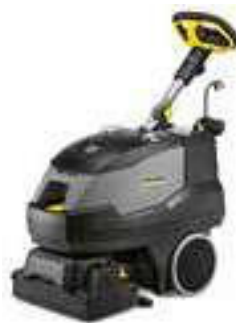
BRC 40/22 C