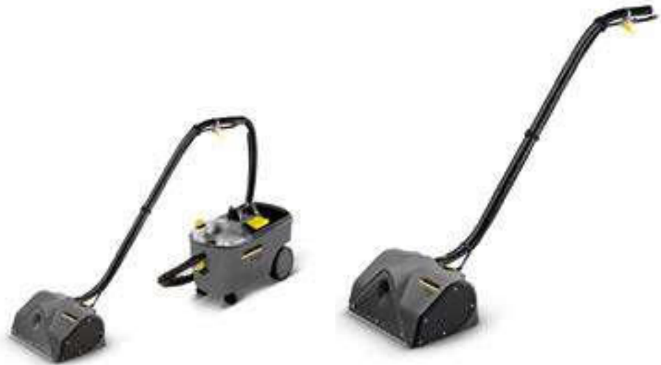
PW 30/1 (Puzzi 10/2 Adv)