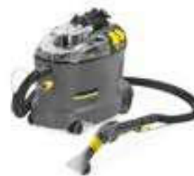
Puzzi 8/1 C