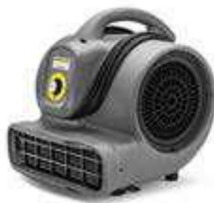
AB 20 Ec