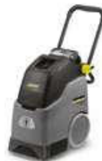
BRC 30/15 C