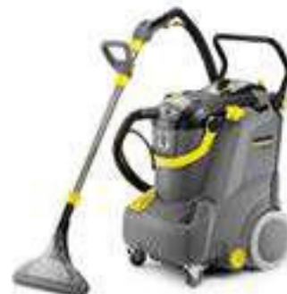
Puzzi 30/4 E