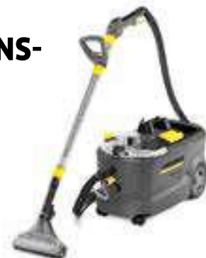
Puzzi 10/2 Adv