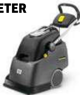
BRC 45/45 C